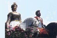
Associazione Culturale "Mata e Grifone"